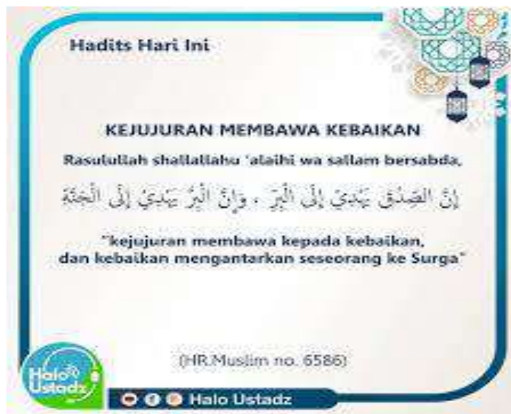
Gambar 1. Infografis Hadis Kejujuran

Di era digital, visualisasi kreatif hadis menjadi sarana efektif untuk mendukung proses digitalisasi dan re-kontekstualisasi ajaran Islam. 15 Dalam konteks ini, visualisasi hadis memanfaatkan media sosial untuk menyajikan pesan hadis secara menarik, mudah dipahami, dan relevan dengan kehidupan modern. Penggunaan format kreatif dalam media sosial seperti gambar, video, infografis, animasi, dan komik menjadi metode utama dalam mengomunikasikan makna hadis sehingga dapat diterima oleh generasi milenial dan Gen Z yang cenderung menyukai konten visual dan singkat. Hadis dengan pesan etika, seperti larangan berbohong atau pentingnya menjaga hubungan sosial, dapat disajikan dalam bentuk infografis dan teks artistik. Ini memudahkan pengguna untuk memahami inti pesan tanpa harus membaca panjang lebar. Hal ini bisa kita lihat sebagaimana pesan etika yang terlihat pada gambar di bawah ini: